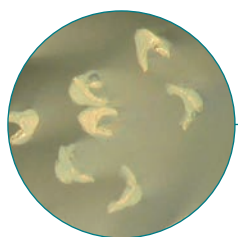
ナイロン毛断面図

V型の断面をもつ最高級特殊ナイロン毛を採用する事により、毛先のまとまりが良く今までにない毛腰のしなり感と切れ味を実現しました。また、ナイロン毛のV型溝により絵具が持ちやすく、ストローク最後のしなやかな抜け具合は最高です。用途に合わせた毛先形状を3タイプ(ラウンド・フィルバート・フラット)からお選び頂けます。